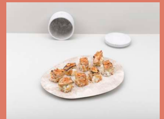
FOIE GRAS CROUSTILLANT

(saumon, fromage saint moret, œuf saumon, avocat, concombre)